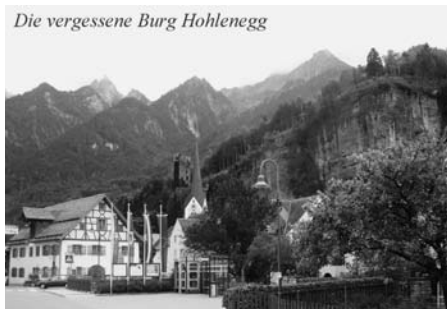
Die vergessene Burg Hohlenegg

eine beeindruckende Wehranlage auf den Felsen oberhalb des Dorfes geprägt wurde. Man nannte sie ursprünglich Balme Hohlenegg, später Schloss Rosenberg.