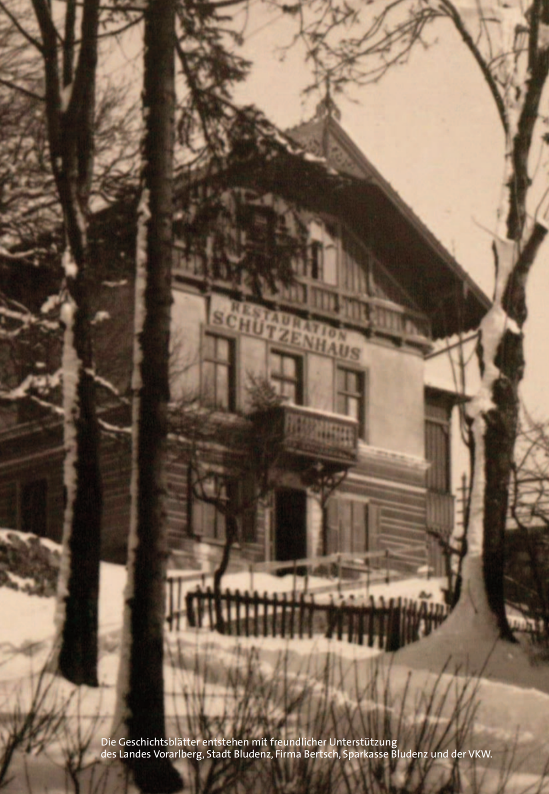
Die Geschichtsblätter entstehen mit freundlicher Unterstützung des Landes Vorarlberg, Stadt Bludenz, Firma Bertsch, Sparkasse Bludenz und der VKW.