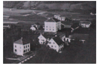
Krankenhaus am Ende des 19. Jahrhunderts

Interessante Fragen zum Themenkomplex Gesundheit und Krankheit und zu Auseinandersetzung und Umgang damit. Erinnern Sie sich gemeinsam mit uns an ‚Gesundes‘ und ‚Ungesundes‘ aus vergangenen Tagen.