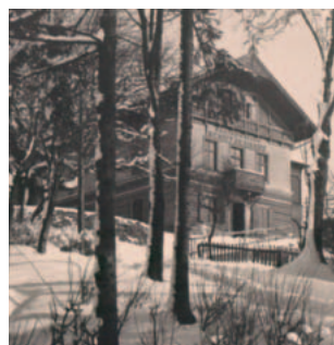
Im Schützenhaus fanden anfänglich die Gottesdienste der evangelischen Gemeinde statt.

Im Anschluss an den Spaziergang wird zu einem Imbiss im Evangelischen Gemeindezentrum eingeladen, bei dem gerne mögliche offene Fragen beantwortet werden.