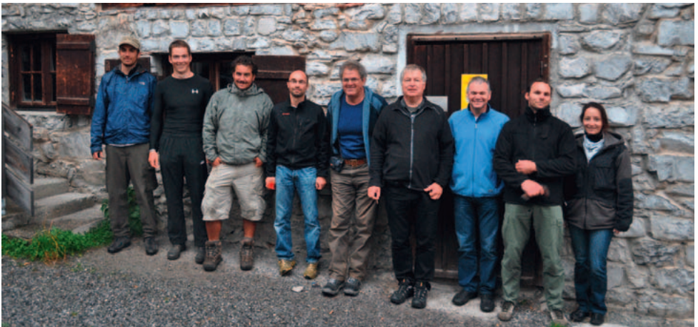
Das Team der letztjährigen Kampagne.