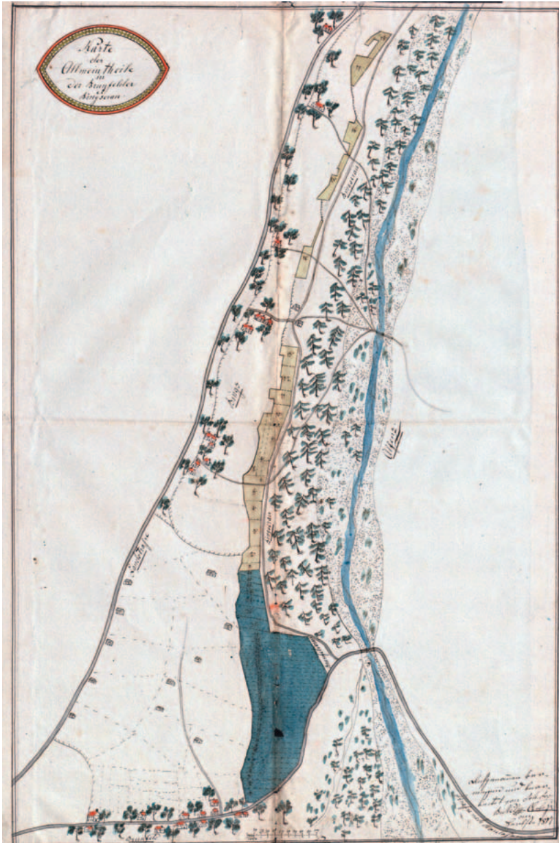
Karte von Brunnenfeld und Bings aus dem Jahr 1817.