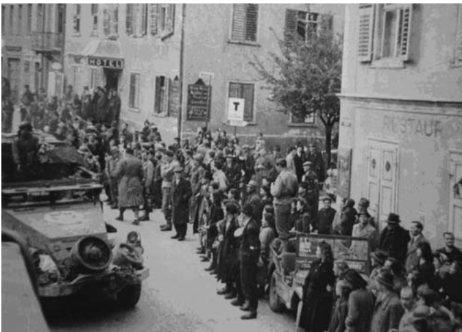
Einmarsch französischer Truppen in Bludenz.