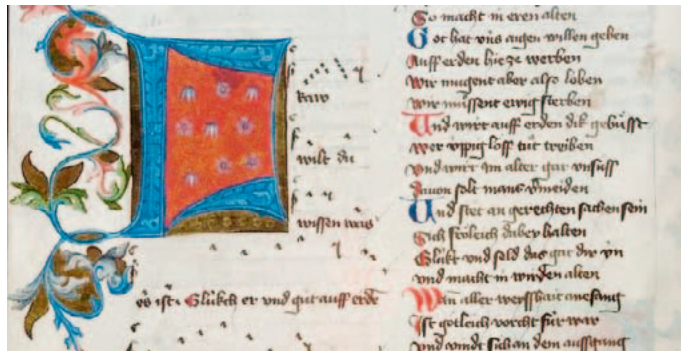
Ausschnitt aus einer Liederhandschrift des Hugo von Montfort, Cod. Pal. germ. 329, Steiermark, 1414/15.