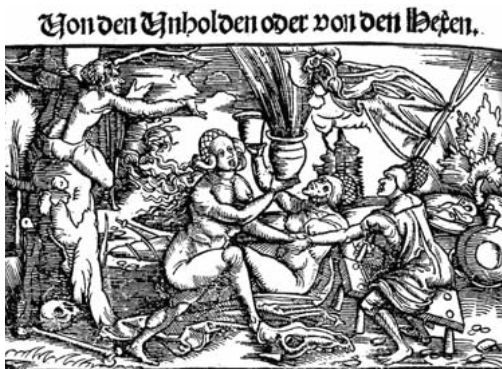
Treiben der Hexen, Holzschnitt aus Johann Greylers von Kaysersbergs Emeis, 1517.

Anmeldung: VHS Bludenz, 05552/65205 oder www.vhs-bludenz.at ; € 40.-