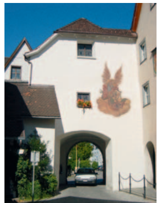
Stadtmuseum von Bludenz

Offenes Atelier in der Mühlgasse 8, Bludenz