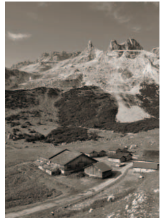
Titelbild: Alpe Spora