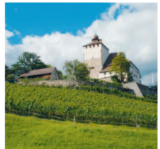
Schloss Werdenberg, KT St. Gallen

Die Tagung beginnt um 9 Uhr und endet nach einer abschließenden fakultativen Führung durch Städtchen und Schloss Werdenberg um ca. 15.30 Uhr. Die Teilnahme ist kostenlos. Detaillierte Informationen zu den Referenten und den genauen Wortlaut ihrer Beiträge erhalten Sie zu gegebener Zeit auf www.hvsg.ch .