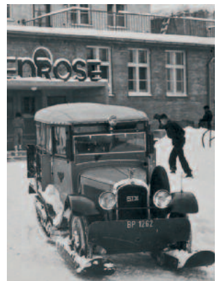
Rückseite: Citroën-Kégresse Raupenfahrzeug der Post vor dem Eingang des Tanzcafés Alpenrose, Postkarte G. Heinzle's Erben, um 1935