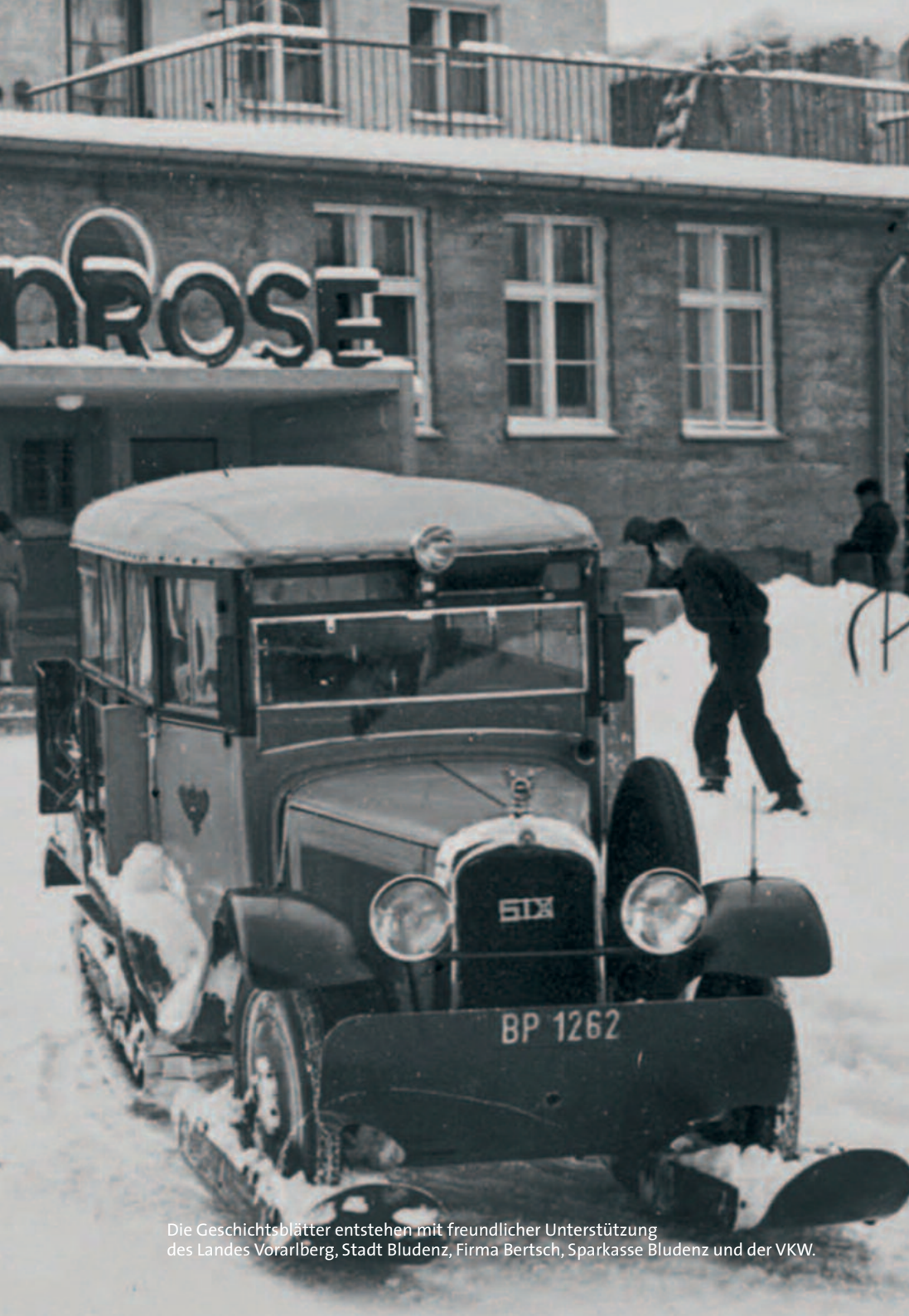
Die Geschichtsblätter entstehen mit freundlicher Unterstützung des Landes Vorarlberg, Stadt Bludenz, Firma Bertsch, Sparkasse Bludenz und der VKW.