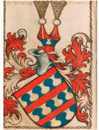
Titelbild: Wappen von Blumenegg Scheiblersches Wappenbuch, 1450