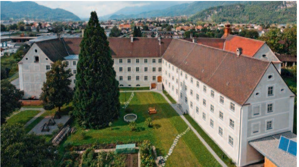
Kloster St. Peter, Bludenz ( www.sankt-peter.at )

Am Sonntag den 28. August 2011 wird das 725-jährige Bestehen des Klosters St. Peter in Bludenz zelebriert. Mit einem Festgottesdienst wird um 9.00 Uhr die Feierlichkeit eingeleitet. Im Anschluss daran findet eine Agape statt. Des Weiteren ist für Mittagessen gesorgt und verschiedene musikalische Beiträge runden die Veranstaltung auf dem Vorplatz des Klosters ab. Im Refektorium und im Klosterladen werden verschiedene Handschriften aus dem Archiv des Klosters dem interessierten Publikum vorgestellt. Um 17.00 Uhr bildet schließlich die Vesper den Abschluss der Feier.